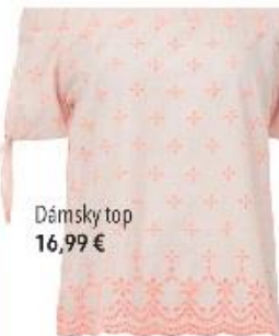
Dámsky top 16,99 €

Podľahnite kúzlu letného trendu farebných výšiviek a strapčekov. Tie dokážu aj z jednoduchého strihu vyčarovať originálny kusok, ktorý si v lete zamilujete.