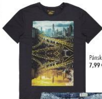
Pánske tričko 7,99 €