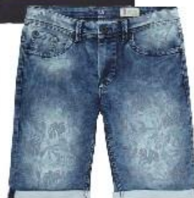
Pánske džínsové šortky 25,99 €