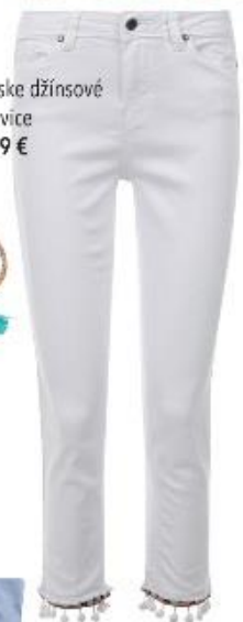
Dámske džínsové nohavice 19,99 €