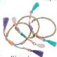
Náramok 6,99 €