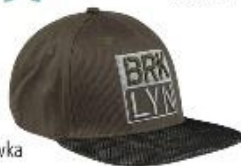
Pánska šiltovka 5,99 €