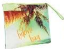
Vrecko na plavky 4,99 €