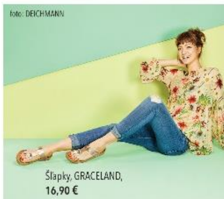
Šľapky, GRACELAND, 16,90 €